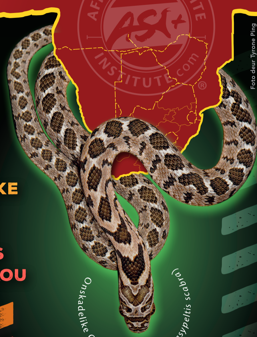
Onskadelike Gewone Eiereveter ( Dasypeltis scabra )