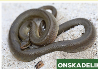
Bruinwaterslang ( Lycodonormorphus rufulus )