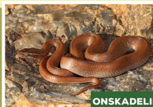
Bruinhuislang ( Boaedon capensis )