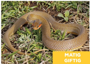
Heraldslang ( Crotaphopeltis hotamboeia )