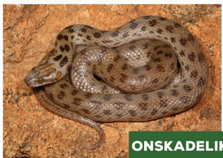
Gespikkelde Rotsslang ( Lamprophis guttatus )