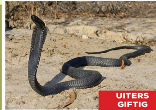
Swartspoegkobra ( Naja nigricincta woodi )