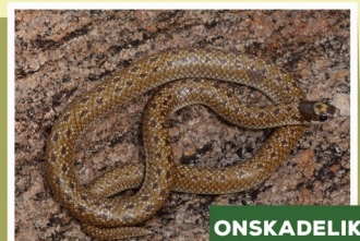
Sundevall se Graafneusslang ( Prosymna sundevalli )