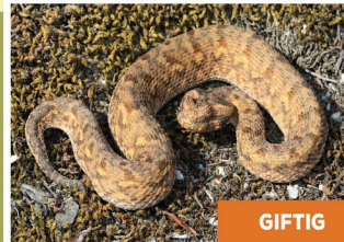
Rooiadder ( Bitis rubida )