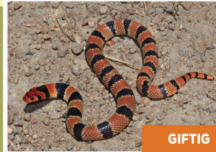
Koraalslang ( Aspidelaps l. lubricus )