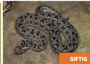
Bergadder ( Bitis atropos )