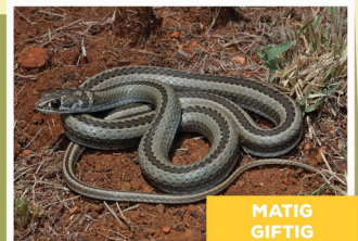
Kruismerkgrasslang ( Psammophis crucifer )