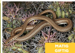
Karoosandslang ( Psammophis notostictus )