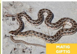
Gevlekte Skaapsteker ( Psammophylax rhombatus )