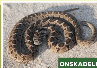
Gewone Eiervreter ( Dasypeltis scabra )