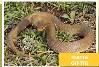
Rooilipslang ( Crotaphopeltis hotamboeia )