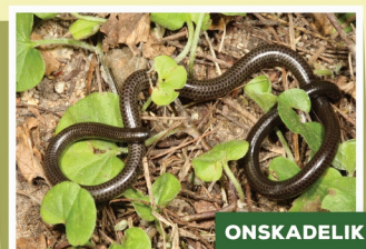
Peters se Erdslangetjie ( Leptotyphlops scutifrons )