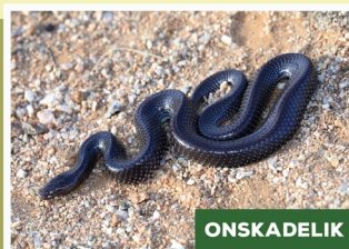
Gewone Wolfslang ( Lycaphidion capense )