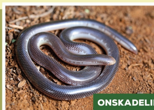
Delalande se Blindevang ( Rhinotyphlops lalandei )