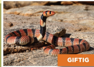
Koraalslang ( Aspidelaps l. lubricus )