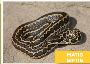
Gevlekte Skaapsteker ( Psammophylax rhombeatus )