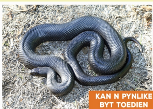
Molslang ( Pseudaspis cana )