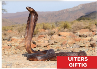
Kaapse Kobra ( Naja nivea )