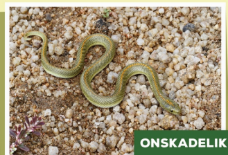
Aurorahuislang ( Lampropholis aurora )