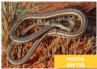
Kalaharisandslang ( Psammophis trinasalis )