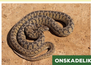
Gewone Eiervreter ( Dasypeltis scabra )