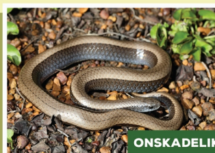
Gewone Slakvreter ( Dubertia lutrix )