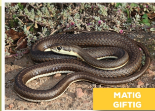
Karoosandslang ( Psammophis notostictus )