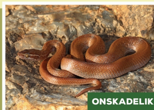
Bruinhuisslang ( Boaedon capensis )