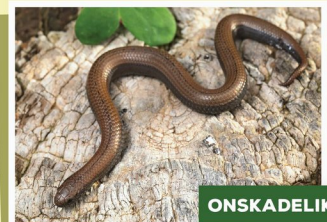
Gewone Slakvretter ( Duberrina lutrix )