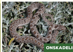
Gewone Eivretter ( Dasypeltis scabra )