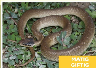
Rooiilpslang ( Crotaphopeltis hotamboeia )