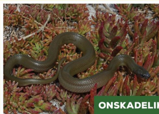
Olyfslang ( Lycodonomorphus inornatus )