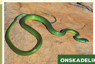
Weslike Natalgroenslang ( Phiothamnus occidentalis )