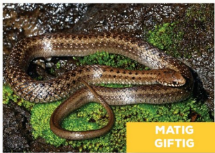
Rietslang ( Amplorhinus multimaculatus )