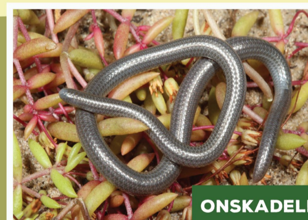
Kaapse Erdslangetjie ( Leptotyphlops nigricans )