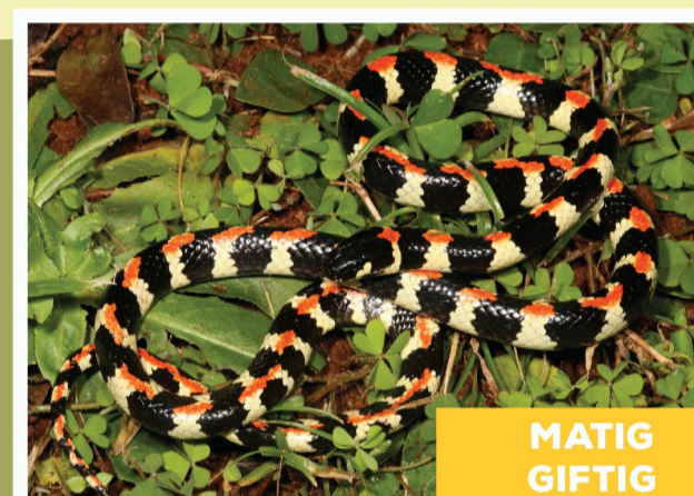
Gevlekte Kousbandjie ( Homoroselaps lacteus )