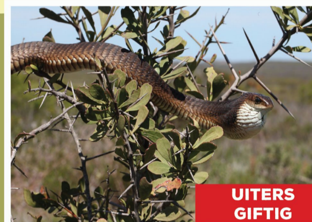
Boomslang - wyfie ( Dispholidus typus )