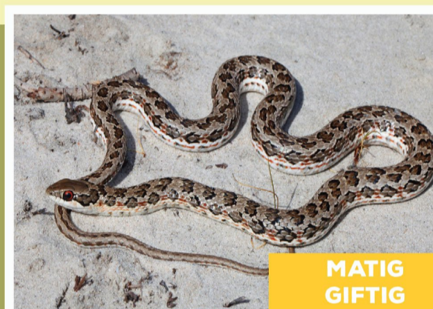
Gevlekte Skaapsteker ( Psammophylax rhombatus )