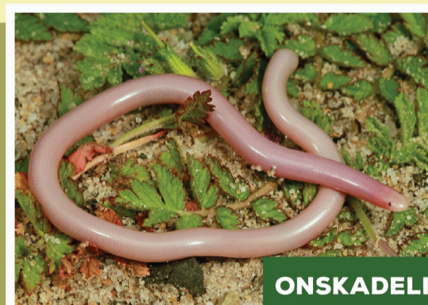
Delelende se Blindeslang ( Rhinotyphlops lalandei )