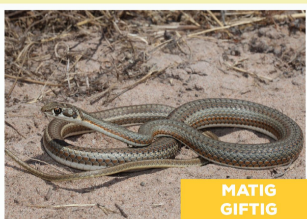
Karoosandslang ( Psammophis notostictus )