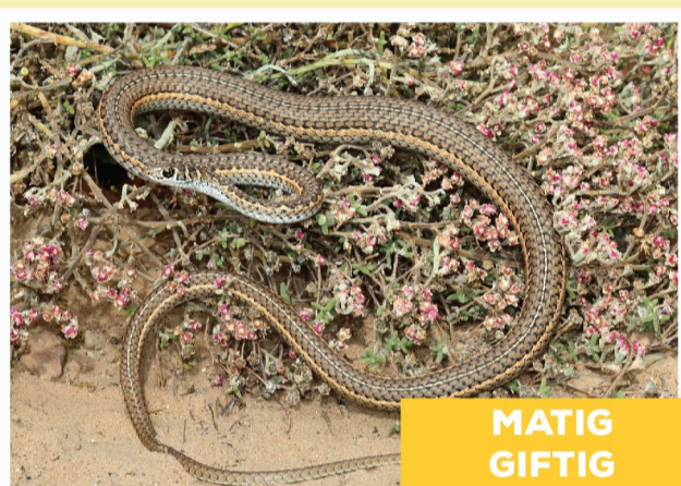
Kaapse Sandslang ( Psammophis leightoni )