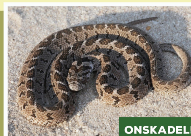
Gewone Eievreter ( Dasypeltis scabra )