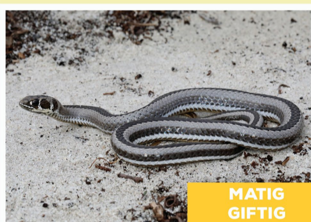
Kruismerkgrasslang ( Psammophis crucifer )