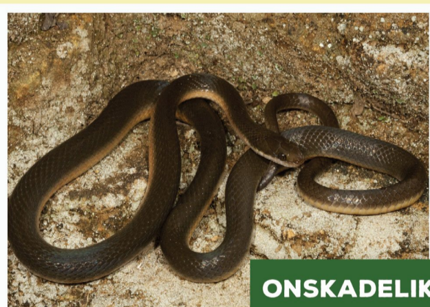
Bruinwaterslang ( Lycodonomorphus rufulus )