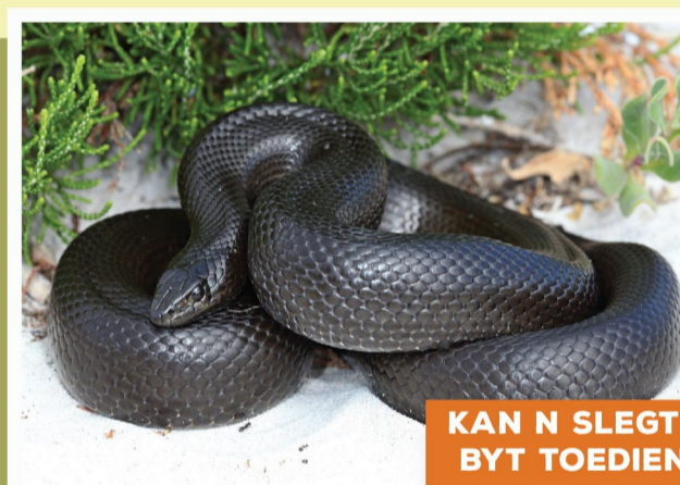
Molslang ( Pseudaspis cana )